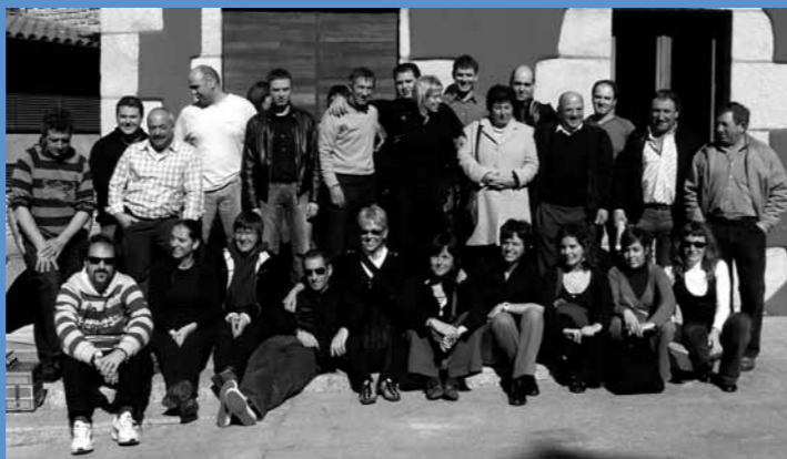
Hona hemen batzar nagusira bildutakoak

Elkartearen dinamikari dagokionez, talde eragile bat biltzen da bi hilean behin, elkartearen berri jasotzeko. Talde horren hurrengo bilera apirilaren 8an izango da, iluntzeko