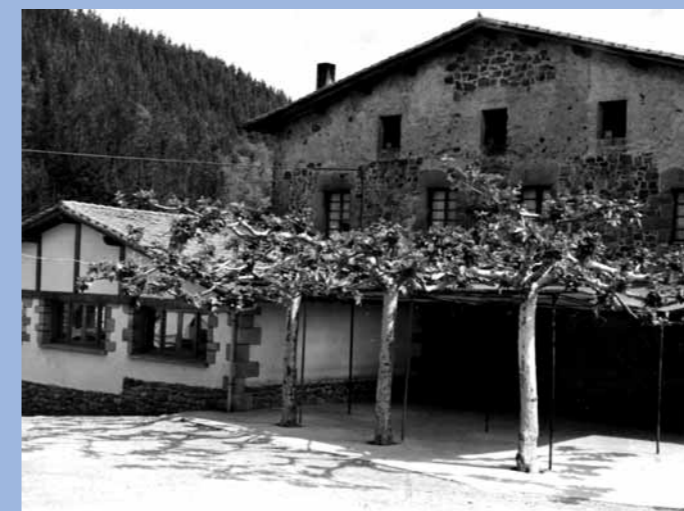
Aristerrazu omenduko da aurten