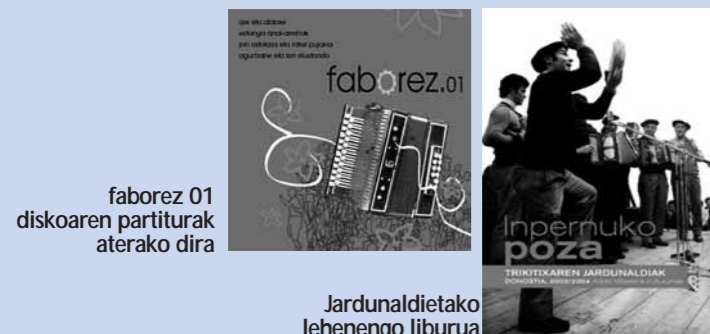
faborez 01 diskoaren partiturak aterako dira

Aurtengo egitasmoen harian, batetik, aurreko urteetako ekimen gehienek jarraipena izango dute, eta, bestetik, ekimen berriek ere hartuko dute lekua. Hala, hainbat lan adostu dira 2008. urterako.