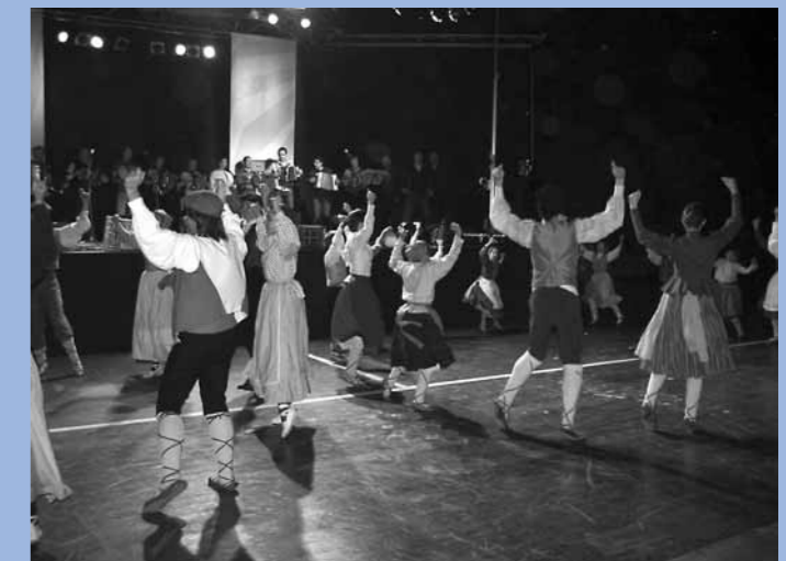
2007ko San Jose Trikiti jaialdiaren amaiera