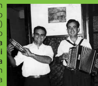
Landakanda eta Maltzeta

Bere hainbat grabazio baditugu esku artean. Garai batekoak, 1965-1970 urte artekoak, Arrate eta Loiolako irratiaren grabatutakoak. Geroztik, hainbat diskotan parte hartu zuen, eta bere diskografian 3 lan biltzen dira. Aita-alabek grabatutakoak hirurak, eta azkena 2001ean kaleratutakoa, Negarrez abesten dut izenekoa.